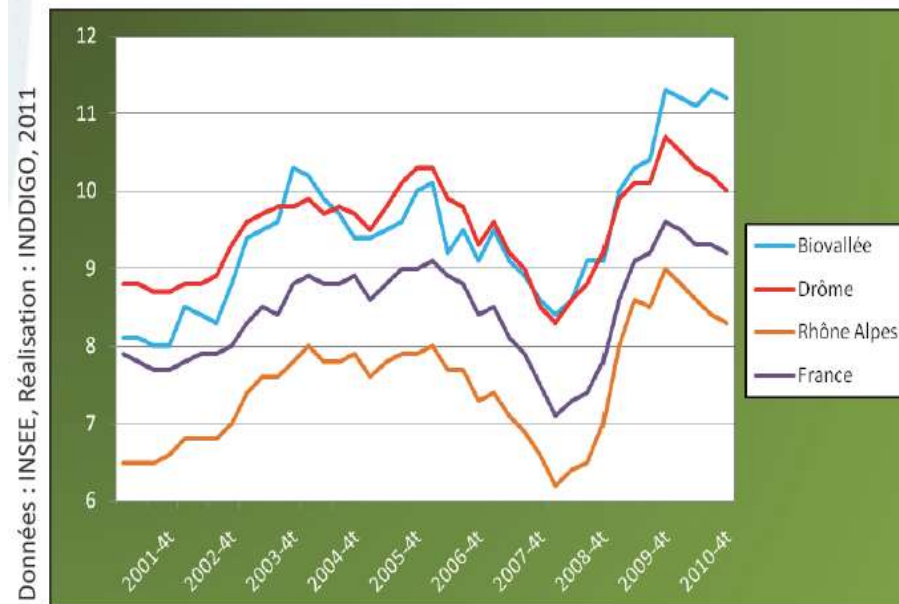
Fig.19 : Taux de chômage trimestriel (en %)